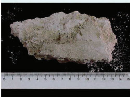
Fragmento de concreto após spalling